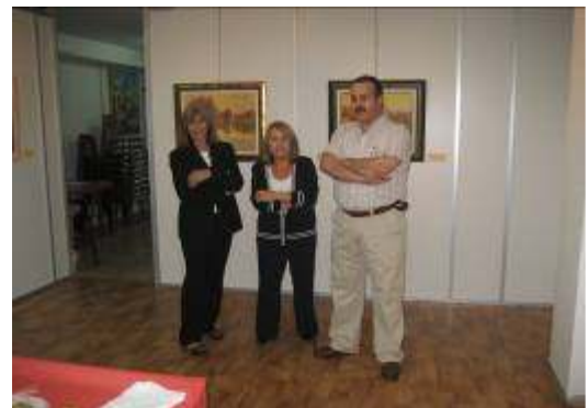
Ambas con nuestro Presidente inaugurando la exposición.