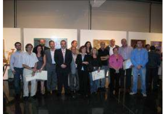
Los Premiados con las Autoridades y presidente de A.B.A.E.