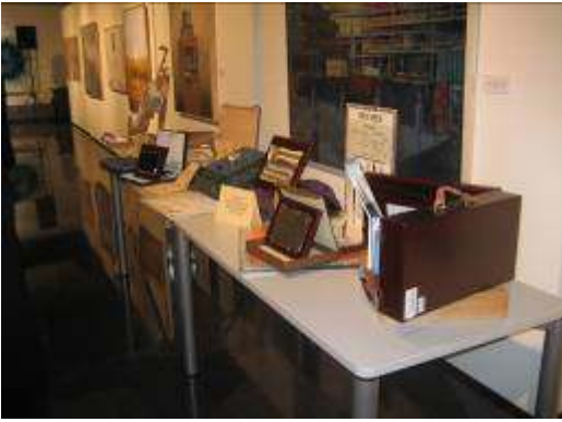
Diplomas y demás premios momentos antes de la entrega.