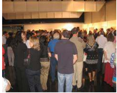
Numerosísimo público asistente a la inauguración del Certamen.